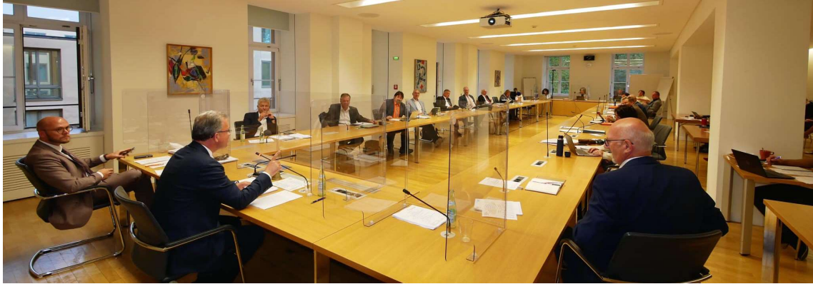
Erste Fraktionssitzung nach der parlamentarischen Sommerpause