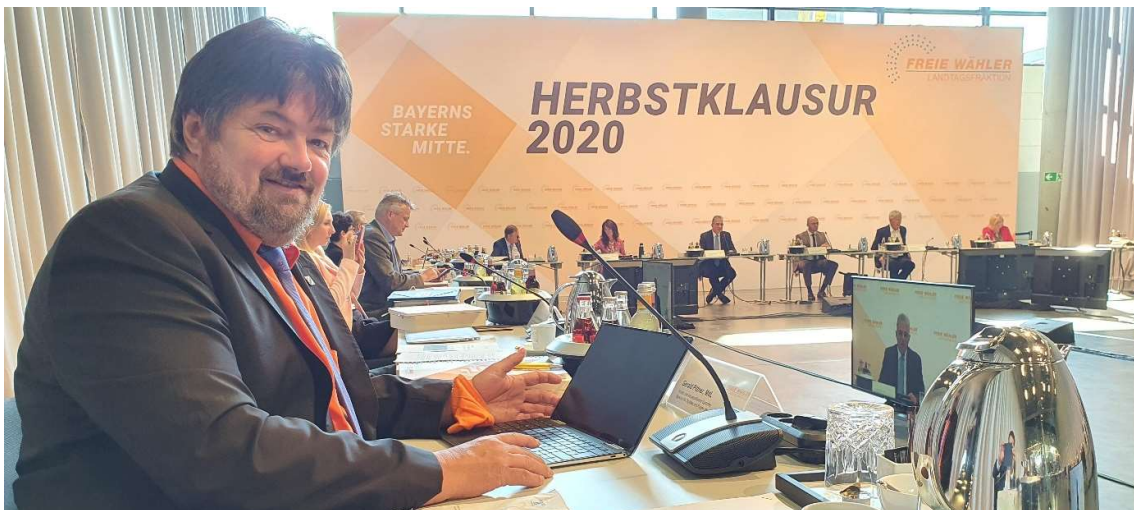
Herbstklausurtagung in München vom 09.-11.09.2020