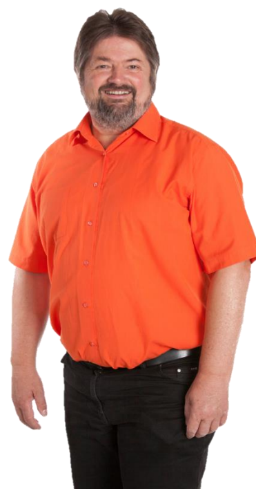
Gerald Pittner, MdL Finanzpolitischer Sprecher

es ist wahrlich keine leichte Zeit, in der wir leben: Immer mehr Menschen infizieren sich mit dem Coronavirus und seit 21. März gelten für Bayerns Bürgerinnen und Bürger Ausgangsbeschränkungen – das öffentliche Leben wurde weitgehend heruntergefahren. Mindestens bis zum Ende der Osterferien wird sich daran nichts ändern. Längst schlägt die Corona-Krise auch auf die bayerische Ökonomie durch, deshalb hat die Staatsregierung den bayerischen Rettungsschirm auf 60 Milliarden Euro erhöht , um es Wirtschaft und Bürgern zu ermöglichen, den Lockdown wirtschaftlich zu überleben. Drastisch erhöht wurde in diesem Zuge auch die von Wirtschaftsminister Hubert Aiwanger ins Leben gerufene Corona-Soforthilfe . Dazu das Wichtigste auf einen Blick: