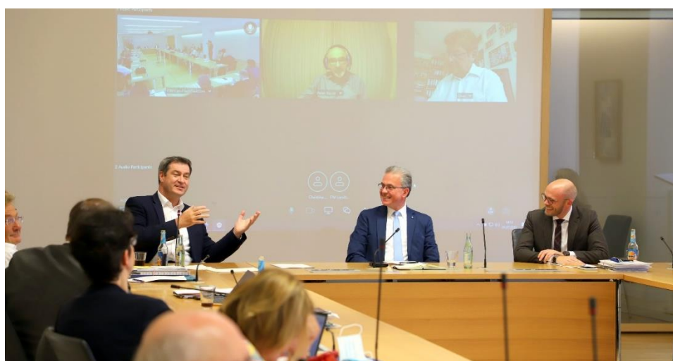
Ministerpräsident Söder in der Fraktionssitzung