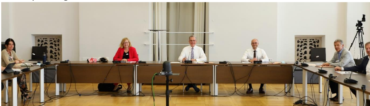
Sitzung des Fraktionsvorstands im Senatssaal des Maximilianeums

Erfreut hat uns die Ausweitung der Corona-Tests . Diese spielen eine entscheidende Rolle bei der Bewertung des Infektionsgeschehens – und sie sind wesentliche Voraussetzung für weitere schrittweise Lockerungen coronabedingter Einschränkungen. Deshalb hatten wir FREIE WÄHLER im Bayerischen Landtag bereits vor Wochen eine deutliche Ausweitung der Testkapazitäten in Bayern gefordert. Mit der ‚Corona-Testoffensive‘ kommt das Gesundheitsministerium dieser Forderung nun entgegen, was wir ausdrücklich begrüßen. Jeder, der einen Test benötigt, wird ihn bekommen. Ziel der Testoffensive ist auch, jedem Bürger, bei dem eine Indikation für Covid-19 vorliegt, die Möglichkeit zu geben, sich rasch und kostenlos testen zu lassen. Grundsätzlich gilt jedoch, dass ein Test nur bei begründetem Verdacht einer Infektion durchgeführt werden sollte, um die vorhandenen Laborkapazitäten nicht überzustrapazieren. Denn die gewünschte flächendeckende Testung ist ein logistischer Kraftakt und derzeit noch nicht möglich. Vielmehr ist die Testoffensive als großzügiges Angebot des Freistaats zu verstehen, das nicht missbräuchlich in Anspruch genommen werden sollte.