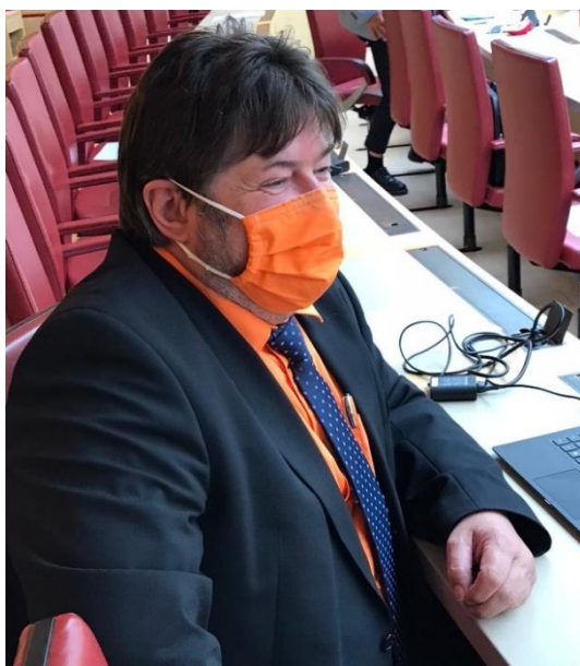
Mundschutzpflicht im Landtag seit 03.07.2020