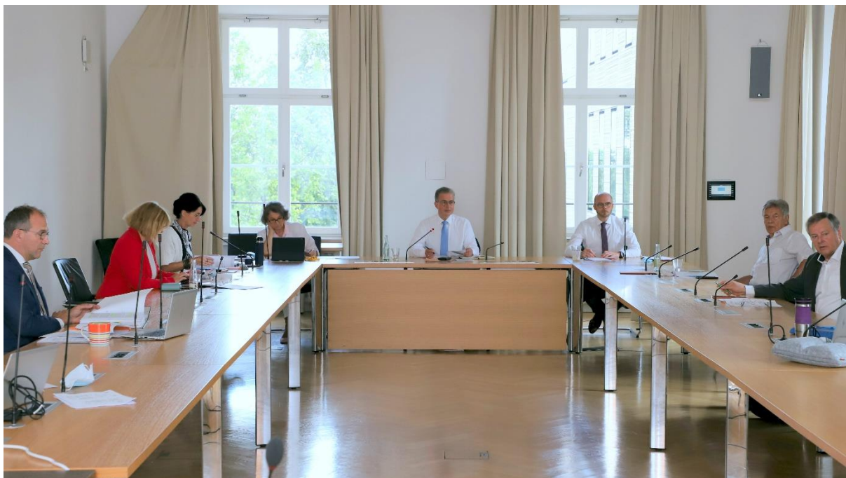
Fraktionsvorstandssitzung am 7. Juli 2020