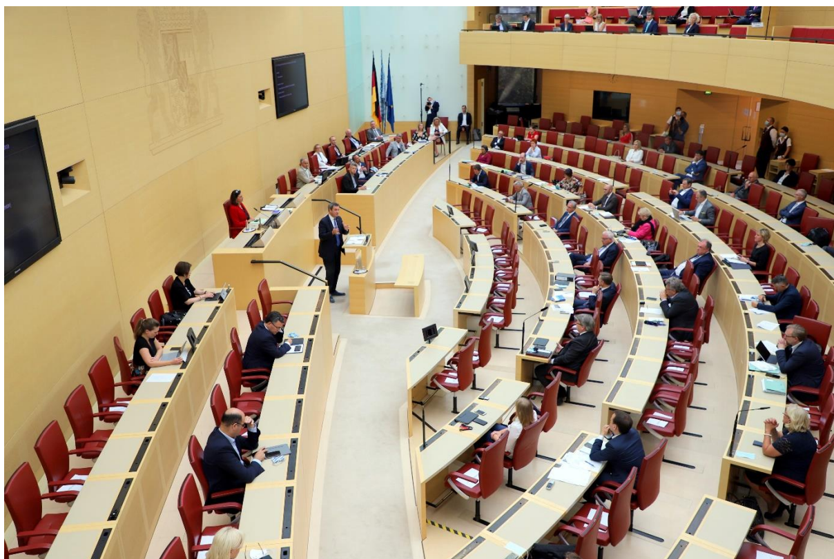
Letzte Sitzung des Plenums vor der Sommerpause

Freistaat sehr genau zu beobachten, um im Zweifelsfall rasch handeln zu können. Das ist ein wichtiges Signal an alle kommunalen Mandatsträger, dass wir sie mit ihren Sorgen und Nöten gerade in Krisenzeiten nicht alleine lassen. Außerdem markiert die Gesetzesänderung den Startschuss für umfangreiche finanzielle Erleichterungen, die sicherstellen werden, dass unsere Kommunen schadlos durch die Corona-Krise kommen. Zusammen mit den staatlichen Unterstützungsleistungen stellen wir auf diese Weise sicher, dass Kommunen nicht unverschuldet in finanzielle Schieflagen geraten und weiterhin ihre Aufgaben der Daseinsvorsorge erfüllen können.