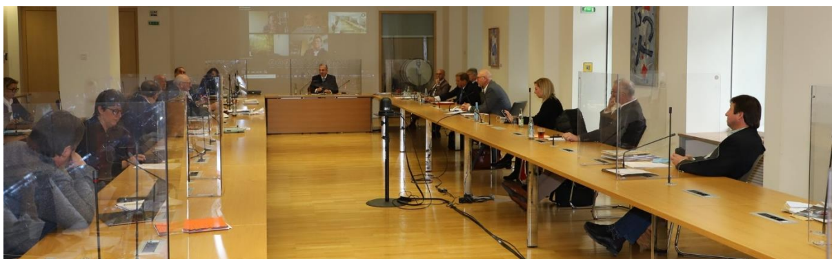
Fraktionssitzung: Plenarvorbereitung und Abstimmung wichtiger Themen

ist Zeit zum Handeln. Oberstes Ziel muss es bleiben, unser Gesundheitssystem nicht zu überlasten. Denn Infektionsschutz ist immer auch Wirtschaftsschutz. Die Corona-Soforthilfen von Wirtschaftsminister Hubert Aiwanger haben schon jetzt tausende Existenzen gerettet – nun muss auch der Bund helfen und die aktuell geltende Mehrwertsteuersenkung um mindestens ein Jahr verlängern. Grundlage für weitere Erfolge bleiben auch offene Schulen , damit Eltern im Job volle Leistung bringen können – deshalb verdient auch Kultusminister Michael Piazzolo für seinen Rahmenhygieneplan an bayerischen Schulen Dank und Anerkennung. Mit der kürzlich eingeführten Corona-Ampel in Bayern wie auch dem Runden Tisch zur Corona-Strategie sind wir bestens gerüstet – beides haben wir als FREIE WÄHLER-Fraktion vorgeschlagen und durchgesetzt . Wir sind überzeugt, dass wir damit die Akzeptanz der Schutzmaßnahmen sicherstellen – und dass das Parlament als Gesetzgebungsorgan neueste Erkenntnisse zum Infektionsgeschehen stets in sein politisches Handeln einfließen lassen kann.