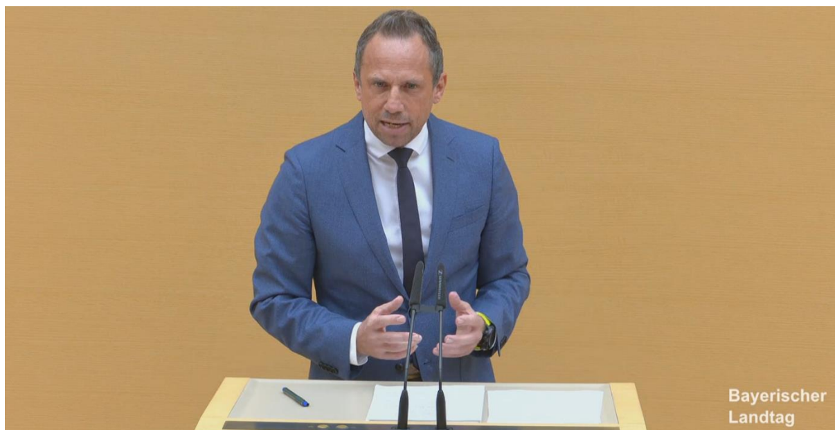
Umweltminister Glauber am 28. Oktober bei seiner Regierungserklärung

schutz einen Meilenstein für die Artenvielfalt gesetzt – das ist besonders wichtig, denn schließlich wollen wir auch für künftige Generationen eine intakte Umwelt in Bayern.