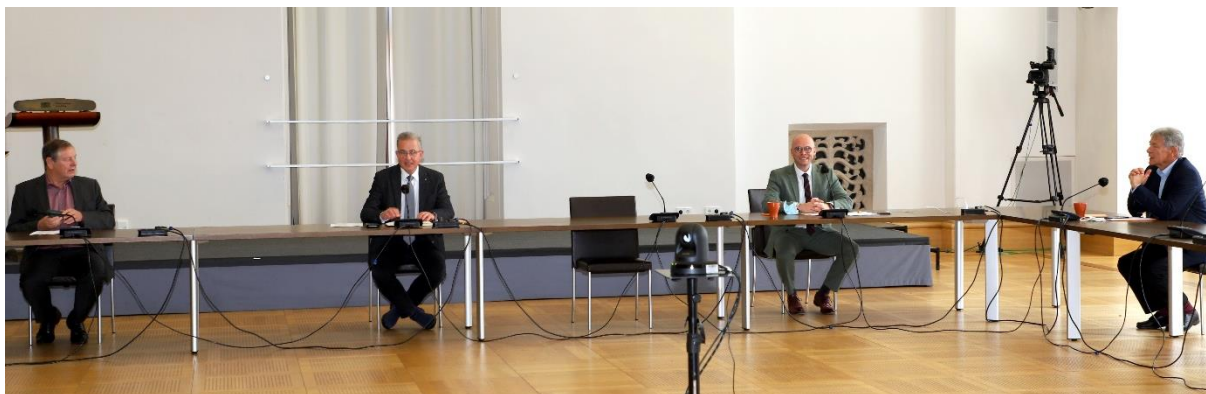
Unser Fraktionsvorstand bereitet die Plenarwoche vor (27.10.2020)

Schritt, um Wasser auch künftig für alle zugänglich zu halten. Mit einer außerplanmäßigen Sonderplenarsitzung debattierten wir die neuen Maßnahmen und legitimieren sie so auch weiterhin demokratisch – schließlich wollen wir alle gemeinsam die schockierenden Bilder von überlaufenen Krankenhäusern aus anderen europäischen Ländern verhindern und rechtzeitig Leben schützen.